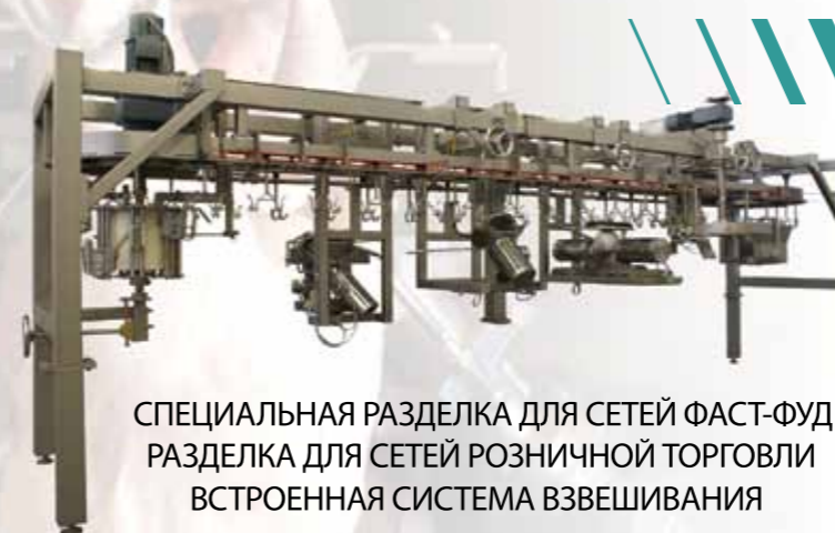
СПЕЦИАЛЬНАЯ РАЗДЕЛКА ДЛЯ СЕТЕЙ ФАСТ-ФУД РАЗДЕЛКА ДЛЯ СЕТЕЙ РОЗНИЧНОЙ ТОРГОВЛИ ВСТРОЕННАЯ СИСТЕМА ВЗВЕШИВАНИЯ