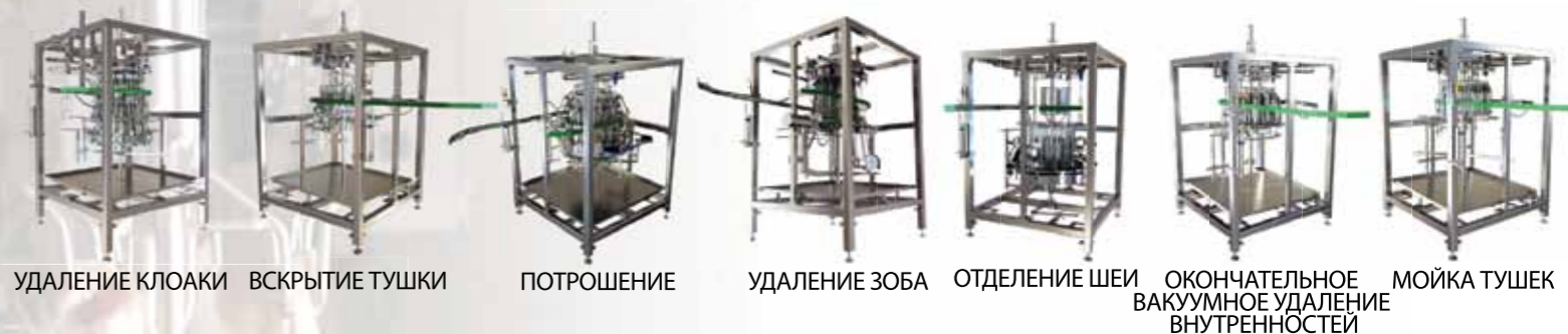
УДАЛЕНИЕ КЛОАКИ ВСКРЫТИЕ ТУШКИ ПОТРОШЕНИЕ УДАЛЕНИЕ ЗОБА ОТДЕЛЕНИЕ ШЕИ ОКОНЧАТЕЛЬНОЕ ВАКУУМНОЕ УДАЛЕНИЕ ВНУТРЕННОСТЕЙ МОЙКА ТУШЕК